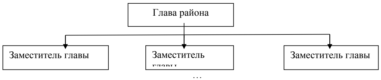
Рисунок 1 – Структура администрации района

Если на рисунке отражены показатели, то после заголовка рисунка через запятую указывается единица измерения, например: